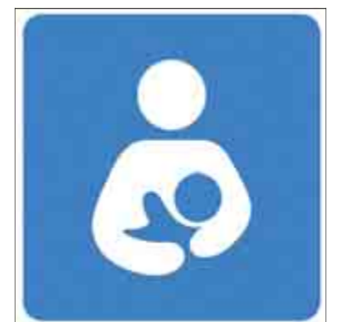
Dieser Aufkleber weist stillenden Müttern den Weg.

BERGISCH GLADBACH. Junge Mütter wissen künftig genau, wo sie ihr Baby in Ruhe stillen können – dank eines neuen Aufklebers. Er symbolisiert als Piktogramm eine Mutter, die ihrem Baby die Brust gibt. Am Dienstag verteilten Schülerinnen und Lehrerinnen des Vinzenz-Palotti-Krankenhauses im Rahmen der Weltstillwoche den Sticker an Cafés, Restaurants, Geschäfte und Institutionen in der Fußgängerzone von Bergisch Gladbach. (EB)