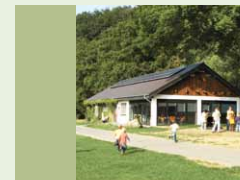
Naturschule Aggerbogen Am Aggerbogen 1 53797 Lohmar