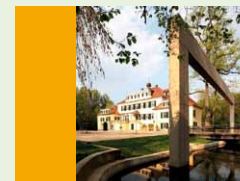
Musik-, Tanz- und Theaterwerkstatt Schloss Eulenbroich Zum Eulenbroicher Auel 19 51503 Rösrath