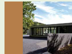
Archäologiewerkstatt Gut Eichthal Eichtal 1 51491 Overath