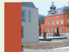
Literatur- & Kunstwerkstatt Bilderbuchmuseum Burg Wissem Burgallee 1 53840 Troisdorf